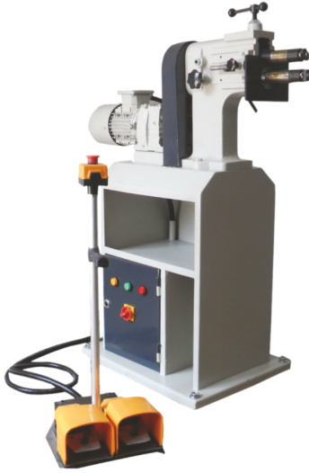
GKM - 1.25