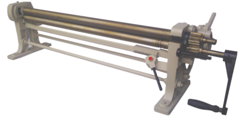
GS - 46