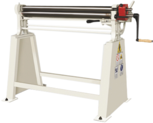
GS - 56