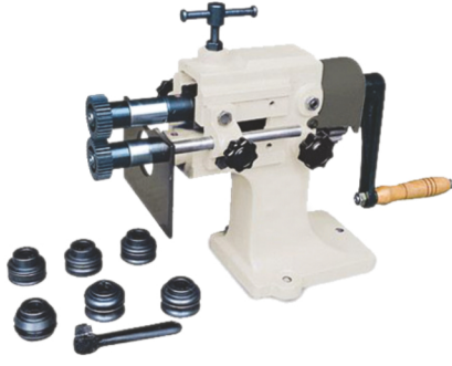
GK - 0.8