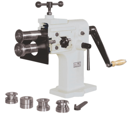
GK - 1.25