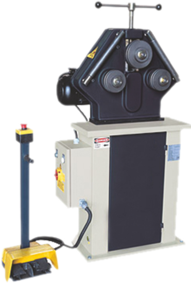
PK - 30