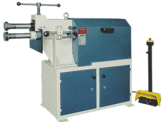
GKM - 4.00